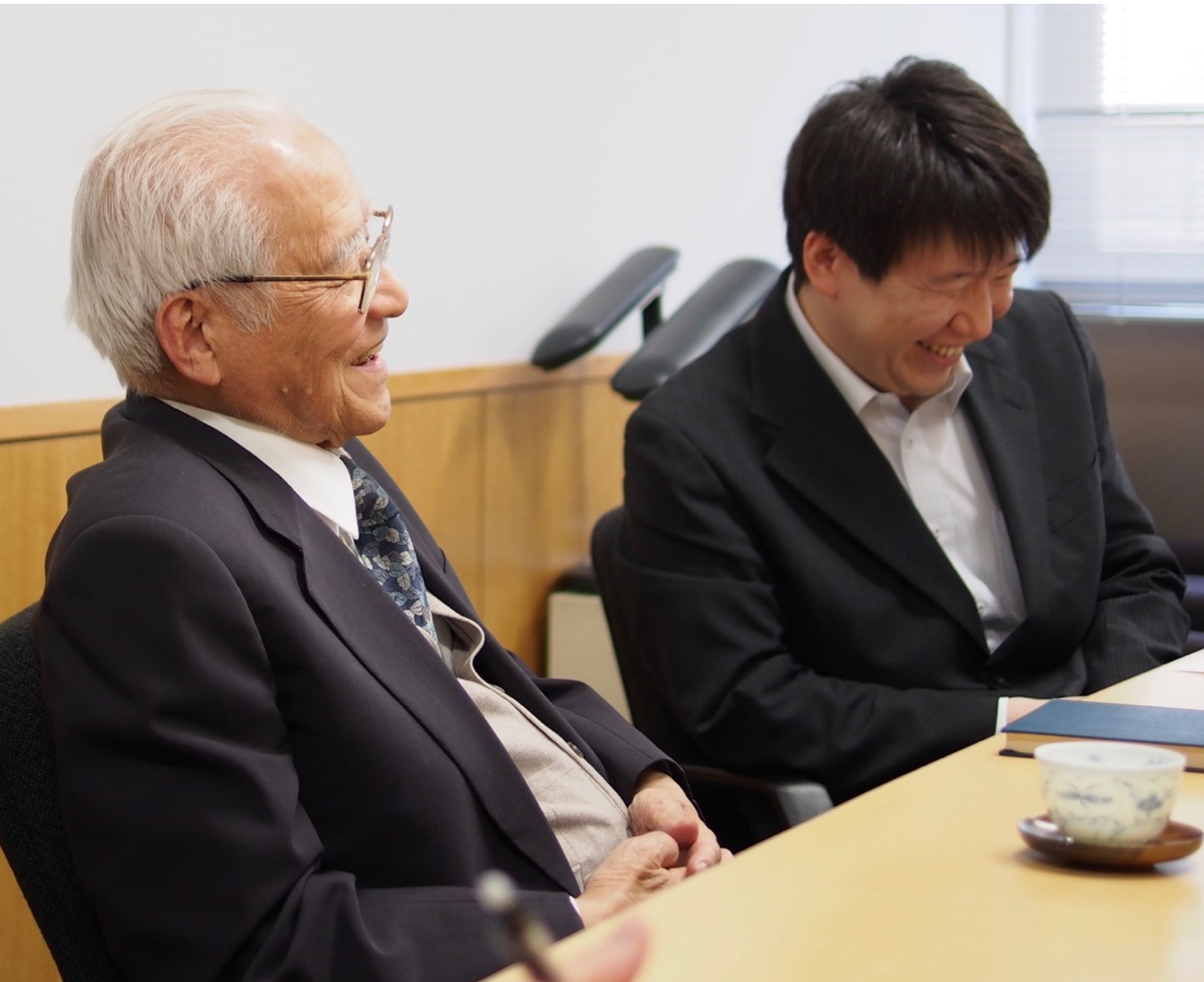
2014年4月、東京大学にて。