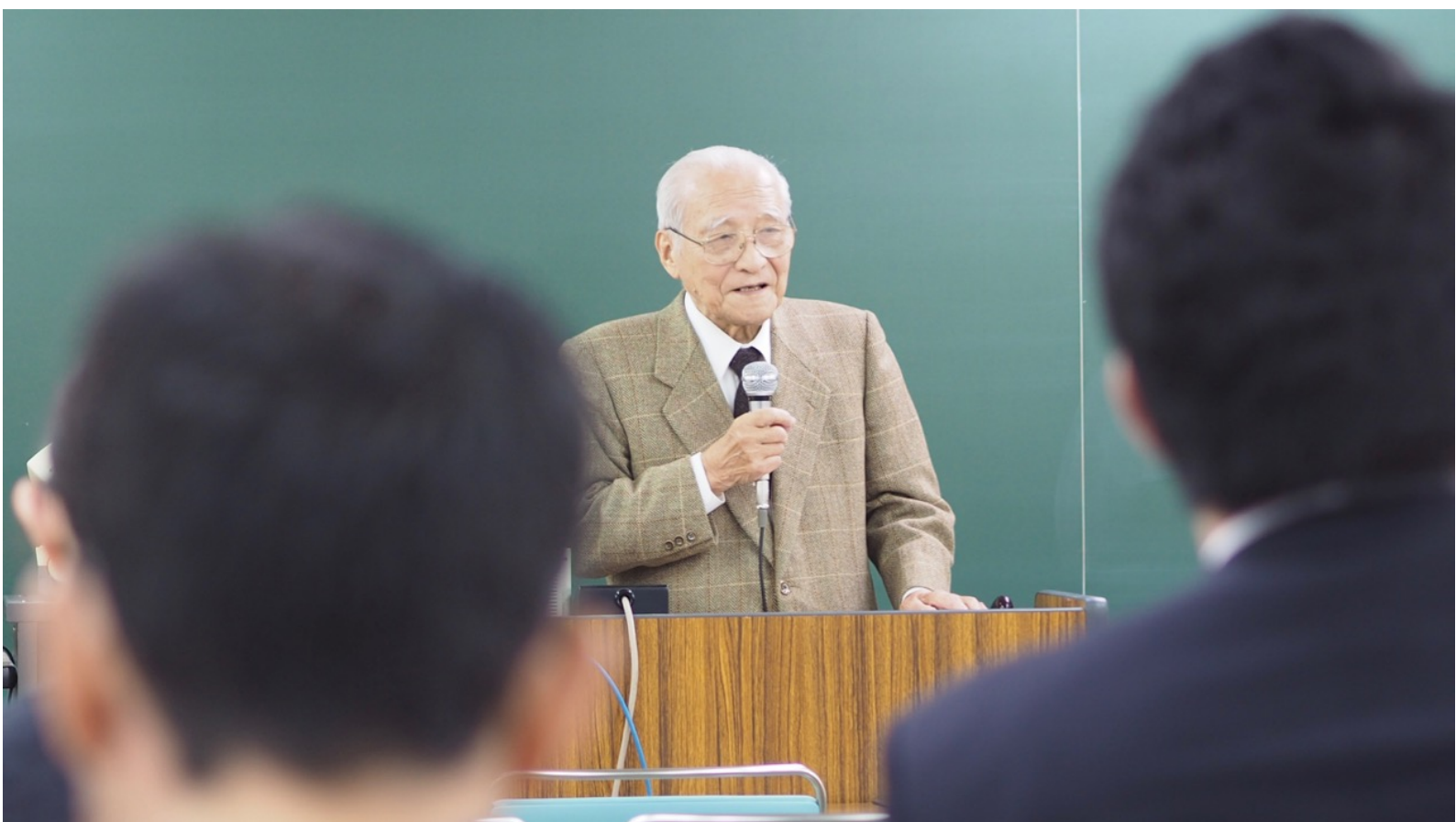
上：2014年7月、下：同年12月、いずれも LEC 会計大学院にて。