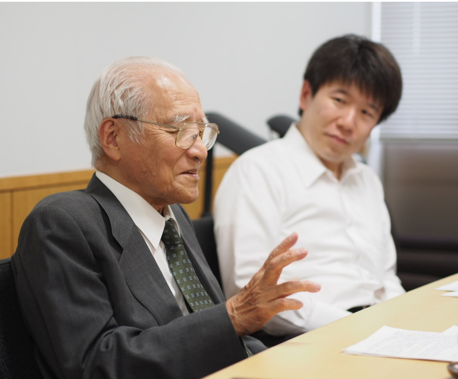
2014年5月、東京大学にて。