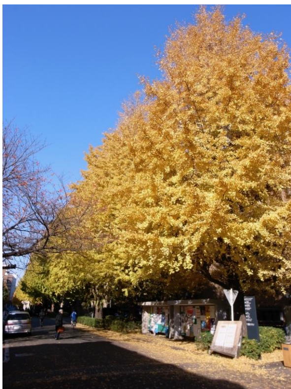
2008年12月、東京大学の銀杏並木