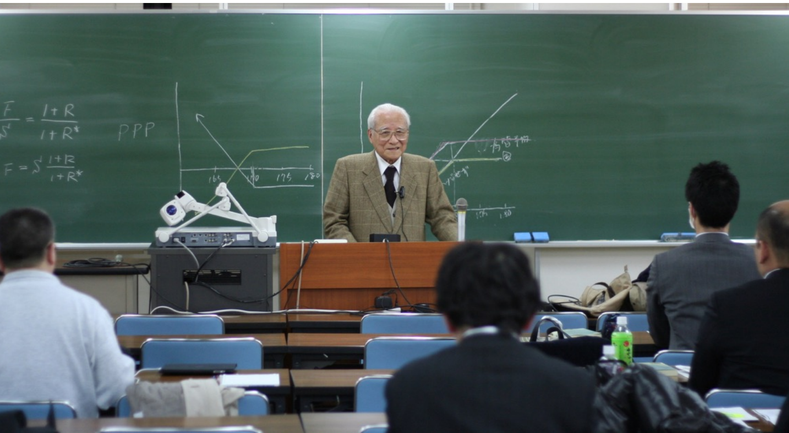
2011年1月、LEC 会計大学院での最終講義