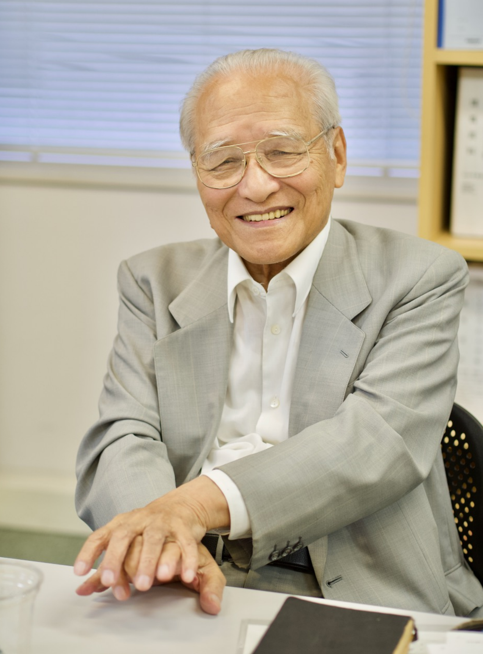
2012年8月、LEC会計大学院にて