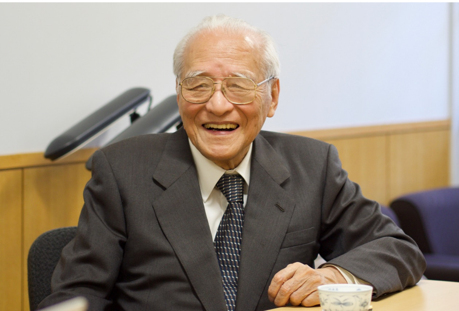
上：2013年12月、下：2014年3月、いずれも東京大学にて。