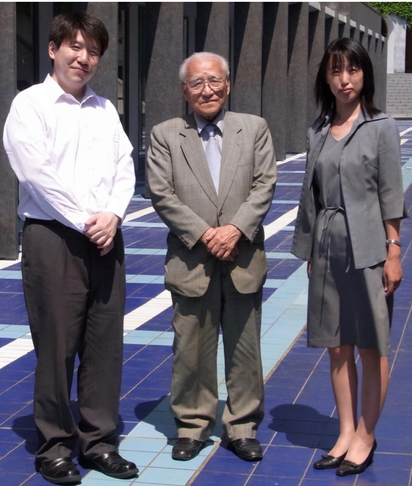
2010年6月、東京大学にて。