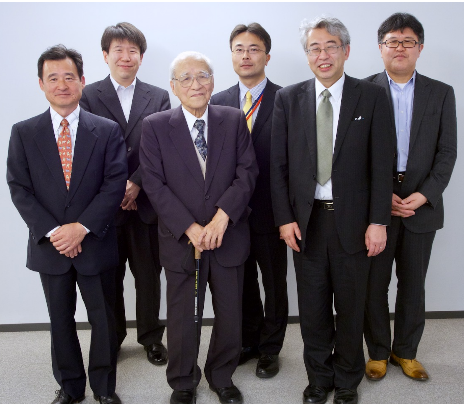
2014年4月、東京大学にて原価計算基準を考える会メンバーと。