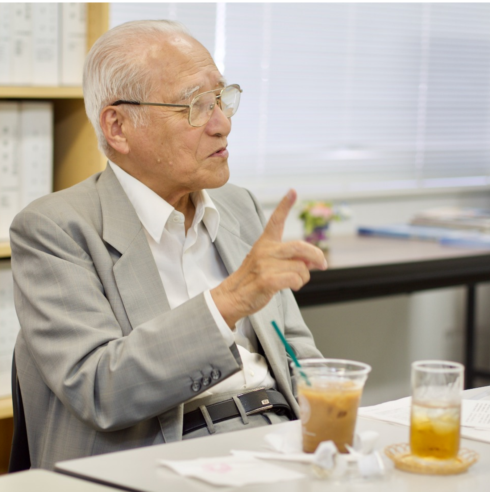
2012年8月、LEC 会計大学院にて